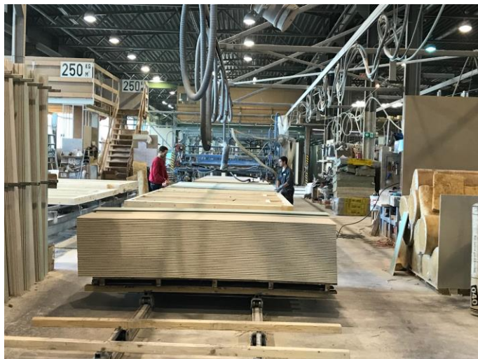
Production ELK à Schrems