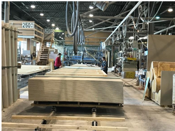
ELK produzione Schrems